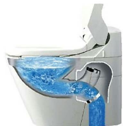
ターントラップ 洗浄方式

アラウーノSは、小洗浄が約4.5L/回から約4L/回になりました。 ※懸排水タイプの場合は洗浄性能確保のため約4.5Lになります。